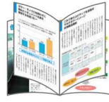
中綴じ 小冊子のように仕上げる