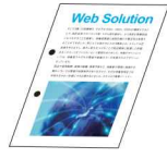
2穴/4穴パンチ ファイリングに便利