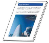
針なし 用紙を金属針を使わずまとめる